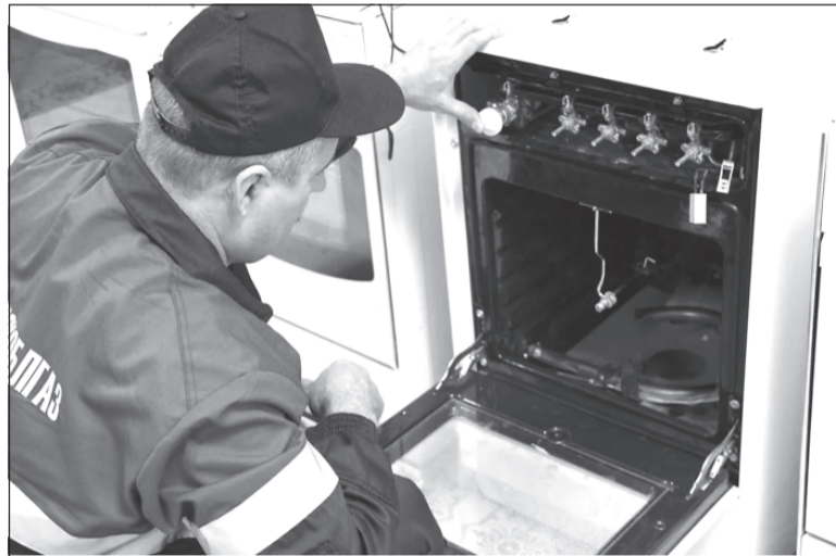
Что с духовкой, хозяйюшка?

Каждый абонент обязан заключать договор о техническом обслуживании ВКГО, может требовать от компании, чтобы она выполнила все прописанные работы. Однако на стоимость обслуживания влияет только количество приборов (плита, счетчик, котел), а вот год выпуска оборудования не играет никакой роли. Неважно, куплена ли газовая плита месяц назад или она стоит со времен царя Гороха, проверять ее на работоспособность теперь положено раз в год. Хотя есть прецеденты в других регионах, когда потребители добивались через суд уменьшения платы за техобслуживание ВКГО, ссылаясь на регламент, по которому для газовой плиты не старше 15 лет осмотры должны производиться не реже одного раза в три года.