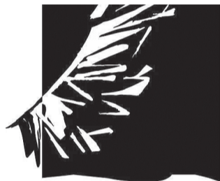
МЕЖДУНАРОДНЫЙ КИНОФЕСТИВАЛЬ ИМ. АНДРЕЯ ТАРКОВСКОГО

В Ивановской области под эгидой Международного кинофестиваля имени Андрея Тарковского «Зеркало» проходят Дни Андрея Тарковского на Ивановской земле, посвященные 87-й годовщине со дня рождения кинорежиссера.