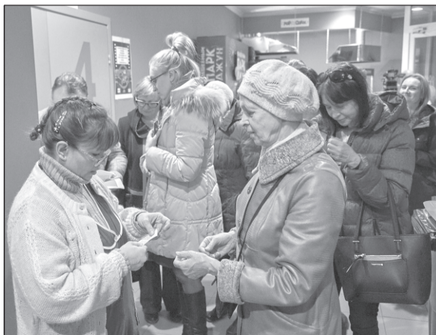
Дни Андрея Тарковского на Ивановской земле