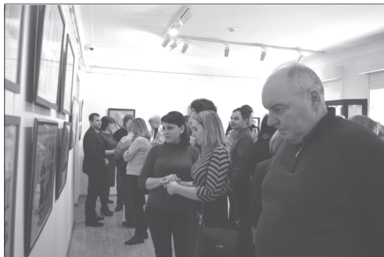
Выставка вызвала большой интерес.