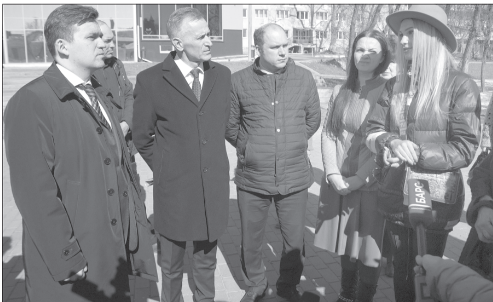
«Самые лучшие контролирующие органы — это мы с вами — жители Ивановской области».

«Права на ошибку больше нет. Не так сделали — свободны», — подчеркнул губернатор Ивановской области Станислав Воскресенский, ознакомившись с результатами благоустройства набережной в Иванове.