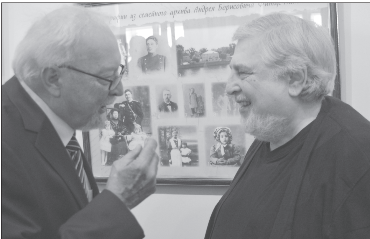
Граф А. Б. Фитце - Ланской и поэт Я. Б. Бруштейн на открытии выставки в Плесе. Материал на тему читайте на стр. 5